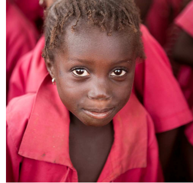
150 Kinder besuchen den Kindergarten in Salikenni

Wie schnell und in welchem Umfang sich diese Idee durchführen lässt, hängt auch davon ab, inwieweit es uns gelingt, Spendenmittel für die weitere Ausstattung des Schulgeländes zu bekommen. Wir sind guten Mutes.