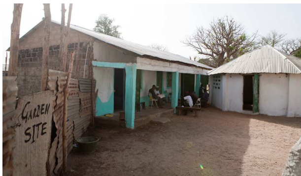
Neues Gebäude mit Administration und Gästeräumen (links), Klassenzimmer mit neuem Dach (rechts)