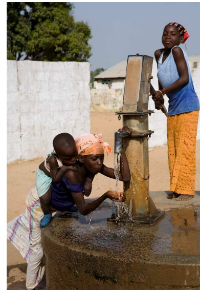
der reparierte Brunnen